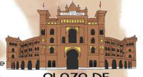
PLAZA DE LAS VENTAS