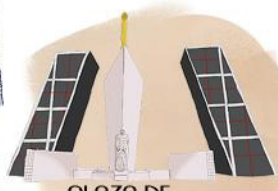
PLAZA DE CASTILLA