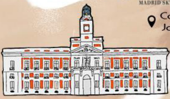
PUERTA DEL SOL