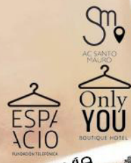
AC SANTO MAURO