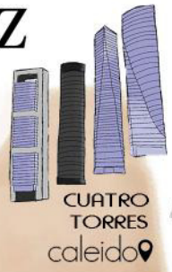
CUATRO TORRES caleido